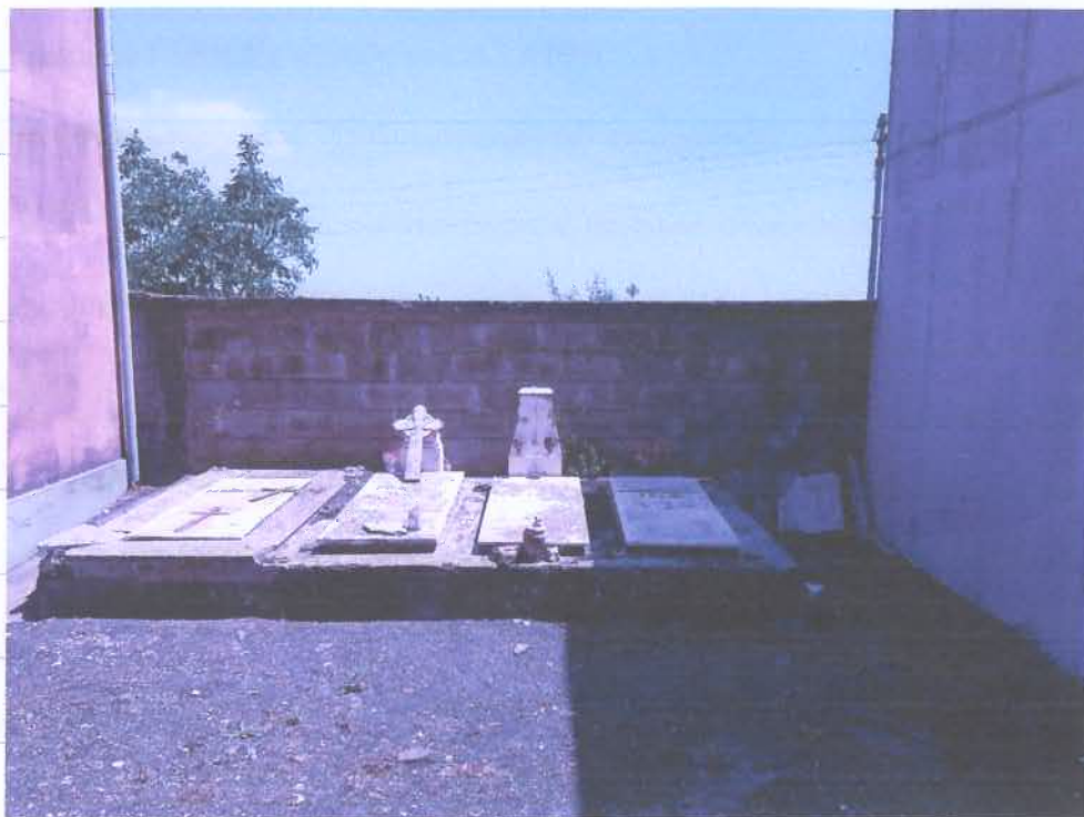
Le tombe insistenti sull'area della Colomhaia n 3